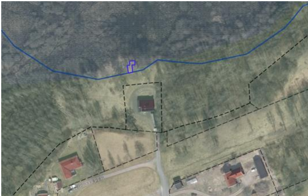
Tomtplatsavgränsning på fastigheten DRÄTTINGE 3:3.

Som särskilt skäl anges att området behöver tas i anspråk för att tillgodose ett angeläget allmänt intresse som inte kan tillgodoses utanför området, enligt 7 kap. 18c § punkt 5 miljöbalken.